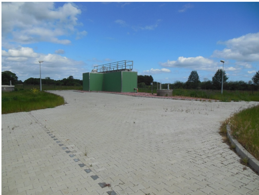
Zdjęcia oczyszczalni ścieków w Brzózkach

W 2018 roku zakończono prace związane z modernizacją kanalizacji w miejscowości Brzózki pod nazwą „Budowa sieci kanalizacji sanitarnej ścieków bytowych, wraz z oczyszczalnią ścieków oraz budowa wodociągu wraz ze stacją hydroforową w miejscowości Brzózki, gmina Nowe Warpno” - ogólna wartość księgową: 4.630.473,70 zł.